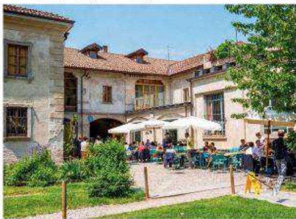
Eten en drinken op een oude boerderij in het centrum van Milaan, kan perfect bij Cascina Cuccagna.